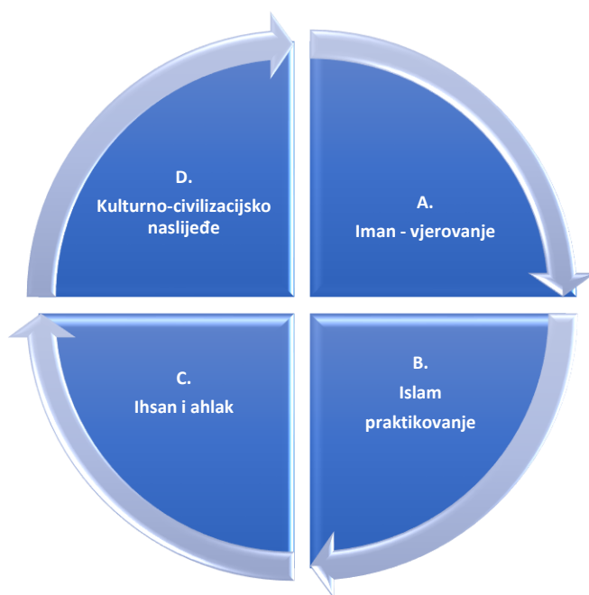
Shema 2. Oblasna struktura predmetnog kurikulumu Islamska vjeronauka

Kulturno-civilizacijsko naslijeđe se posmatra iz različitih perspektiva u predmetima: B/H/S jezik i književnost, vjeronauk/a, moja okolina, društvo, historija, geografija, sociologija, pedagogija, filozofija, kultura i zajednica, etika, kultura religija, muzička kultura, likovna kultura.